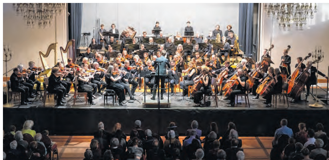
Das wesentlich erweiterte Orchester auf der vergrösserten Landgasthofbühne zieht das Publikum in seinen Bann.